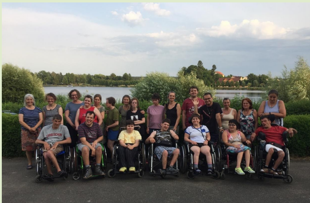
Chlum u Třeboně