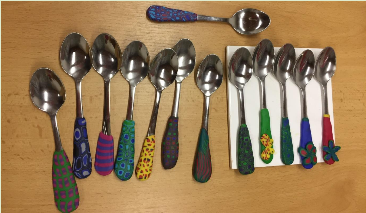
Fimo - lžičky