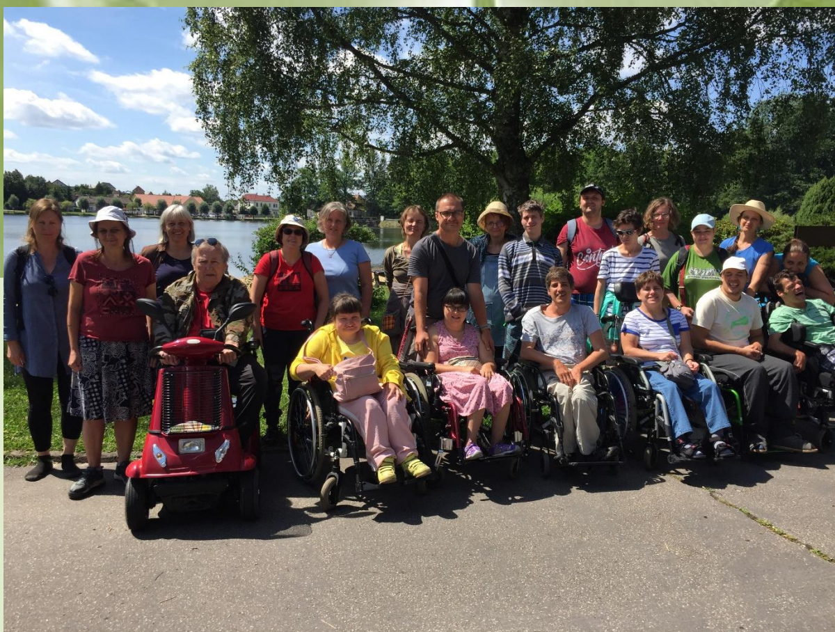
Chlum u Třeboně 2022

Podařilo se uskutečnit další ročník oblíbeného letního rekondičního pobytu lidí se zdravotním postižením v Chlumu u Třeboně. Prožili jsme krásný a pohodový čas uprostřed vlídné jihočeské přírody, který jsme vyplnili výlety, koupáním, společným muzicírováním a výtvarným tvořením. Akce se zúčastnilo 13 lidí se zdravotním handicapem a 9 asistentů. Pobyt se uskutečnil díky podpoře Nadace ČEZ a firmě PEKLOČERTOVINA, s.r.o.