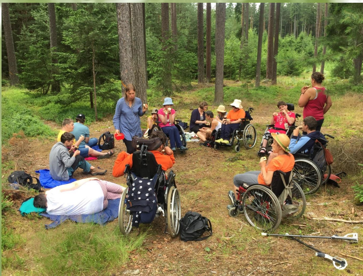
odpočinek v lese