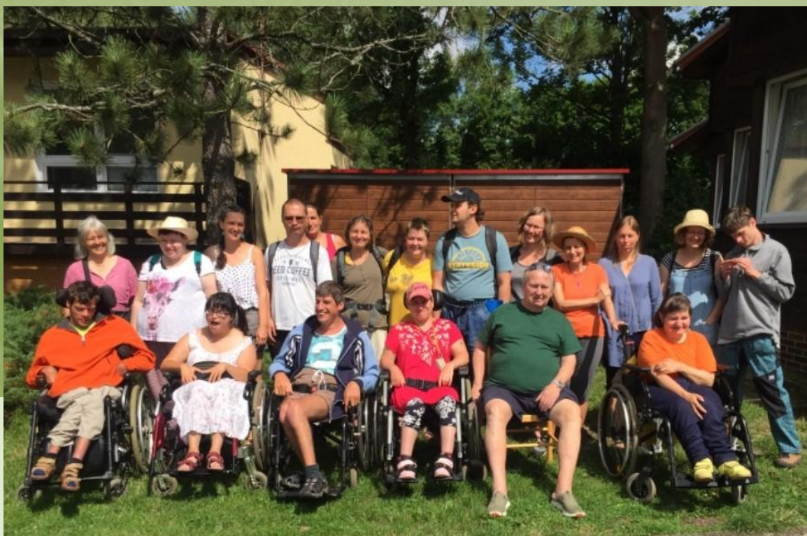
účastníci letního pobytu