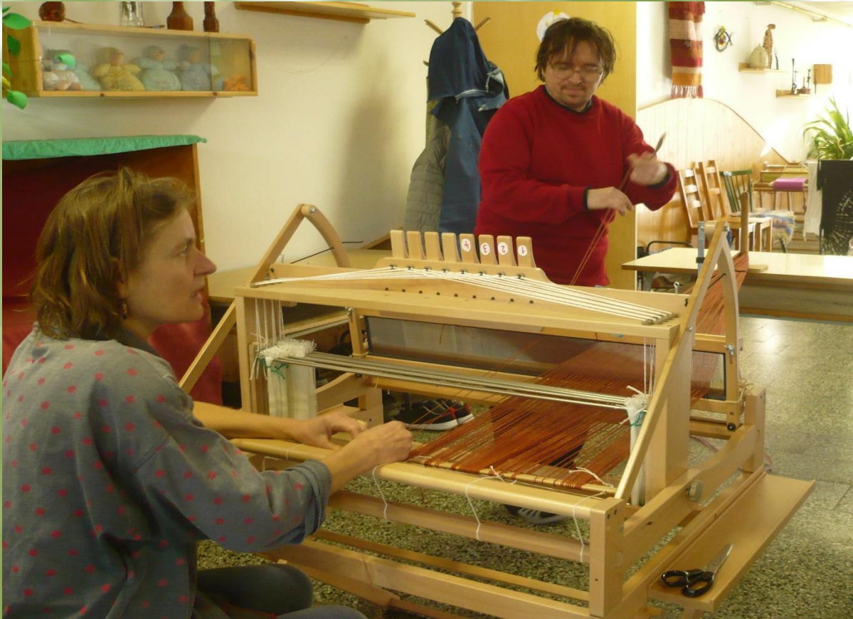
8listý tkalcovský stav