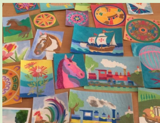
obrázky z barevného písku